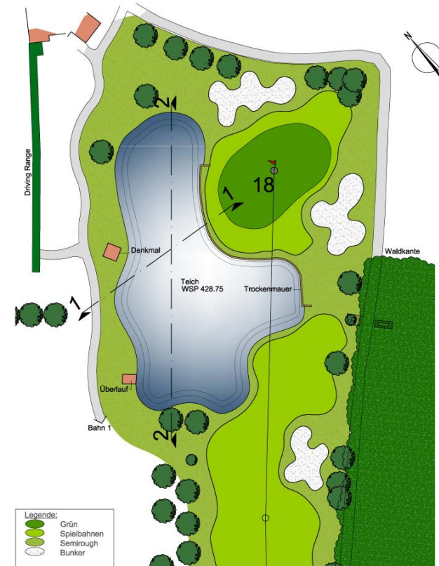
Entwurf M 1:500